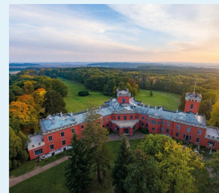
Hrádek u Nechanic