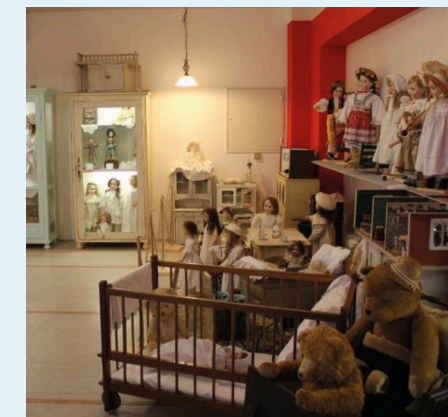
Muzeum hraček Stuchlíkovi