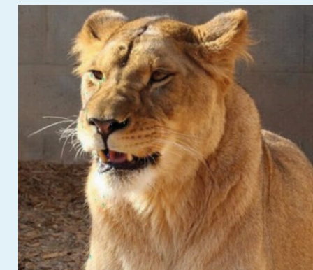
Animal park Rabina